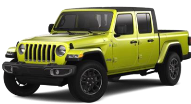
596 (opc. PJF) Rumena - Velocity (pastelna barva)