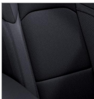
opc 8E7 (S – Overland) Črna tkanina