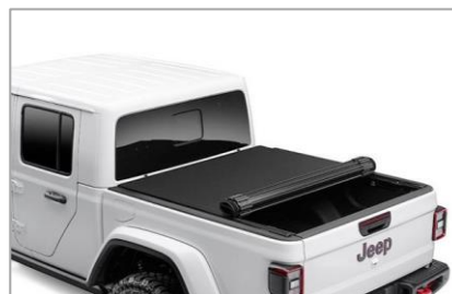
(opc. CSD) Pokrov kesona (Roll-up)