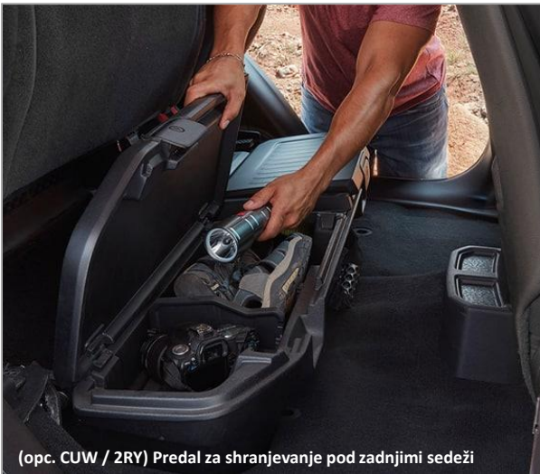
(opc. CUW / 2RY) Predal za shranjevanje pod zadnjimi sedeži