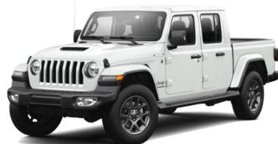
PW7 (opc. OUU) Bela Bright White (pastelna barva)