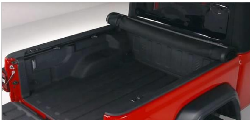
(opc. CSD) Pokrov kesona (Roll-up)

■ serijska oprema, - ni možno, - v paketu (del enega izmed paketov) Navedene cene so v EUR in vključujejo DDV.