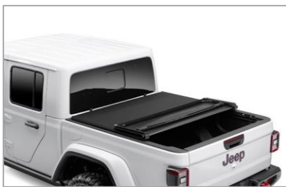
(opc. CT6) Pokrov kesona (3-delni Soft) Mopar®