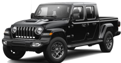
PX8 (opc. OUT) Črna Black (pastelna barva)