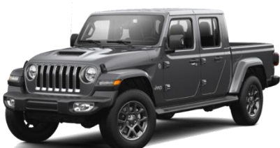
PAU (opc. OSD) Siva Granite Crystal (kovinska barva)