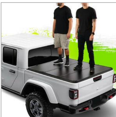
(opc. CSU) Pokrov kesona (3-delni Hard) Mopar®