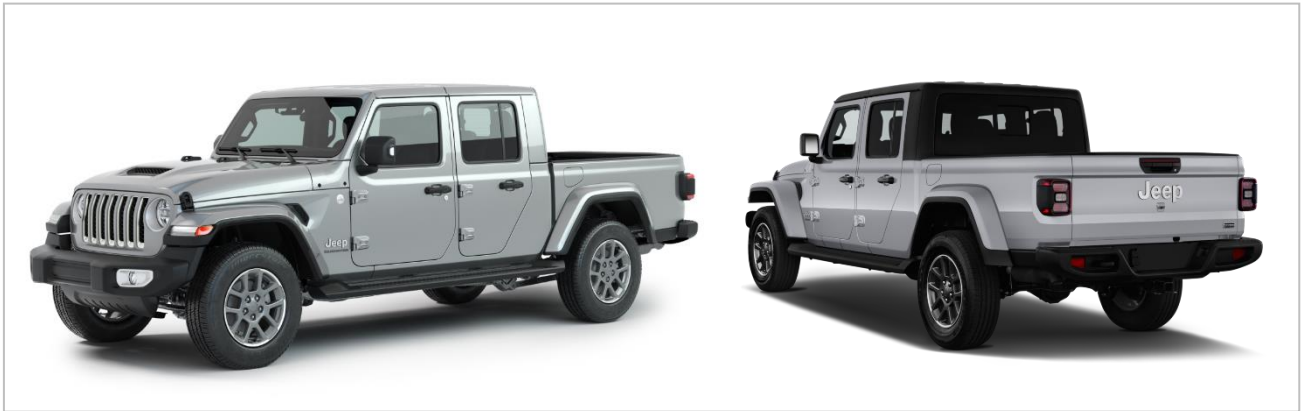
(opc. CT6) Pokrov kesona (3-delni Soft) Mopar®