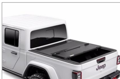
(opc. CSU) Pokrov kesona (3-delni Hard) Mopar®