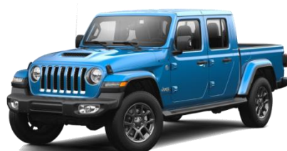
PBJ (opc. OQ0) Modra Hydro Blue (biserna barva)