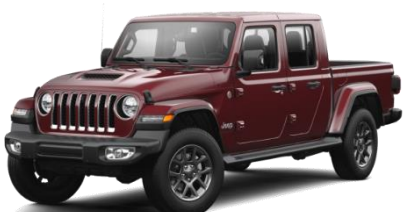
PRV (opc. 6FX) Rdeča Snazzberry (biserna barva)