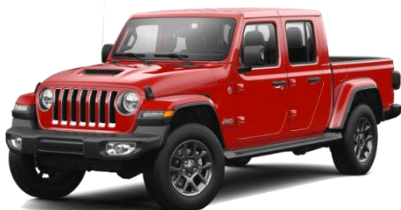
PRC (opc. OPY) Rdeča Firecracker (pastelna barva)