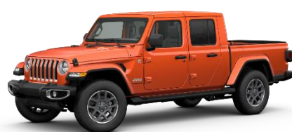
PE4 (opc. OPZ) Oranžna - Punk'N Metalic (kovinska barva)

Pridržujemo si pravico, da kadarkoli in brez predhodne najave spremenimo cene, opremo in tehnične podatke. O obvezujočem zadnjem stanju se zanimajte pri svojem prodajalcu.