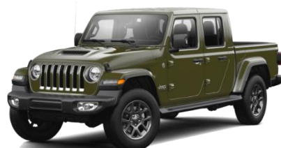
PGG (opc. 74F) Zelena Sarge Green (pastelna barva)