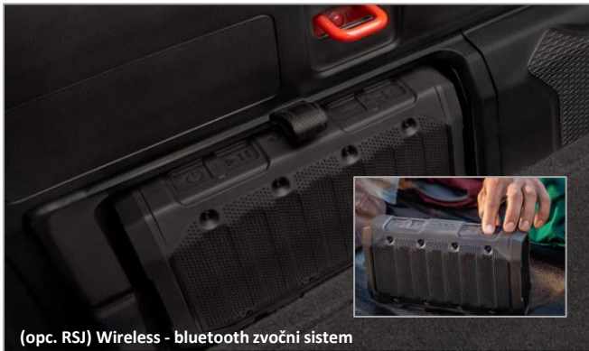
(opc. RSJ) Wireless - bluetooth zvočni sistem