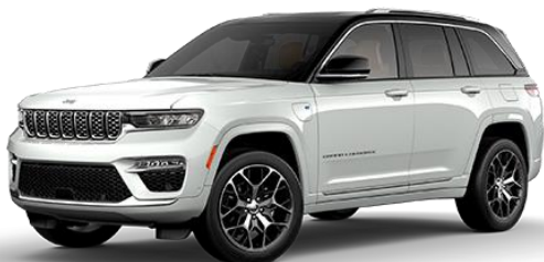
Bela - Bright White / črna streha (pastelna barva) (207/ opc. 0UU)