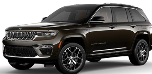
Rjava - Rocky Mountain / črna streha (kovinska barva) (707/ opc. 0Q1)