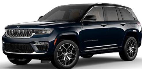
Modra - Midnight Sky / črna streha (kovinska barva) (410/ opc. 0QQ)