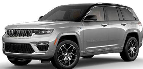
Siva - Zynith Silver / črna streha (kovinska barva) (605/ opc. 0SE)