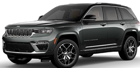
Siva - Baltic Grey / črna streha (kovinska barva) (602/ opc. 0PY)