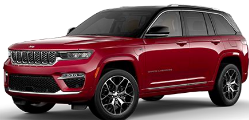
Rdeča - Velvet Red / črna streha (kovinska barva) (PRV/ opc. 0SD)