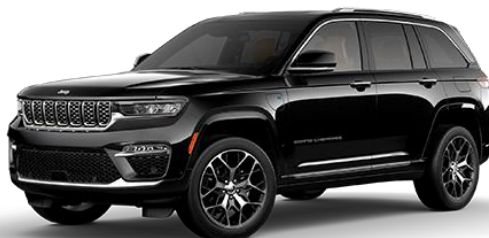
Črna - Diamond Black (kovinska barva) (PXJ/ opc. 61Q)